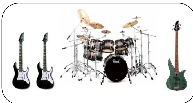
ภาพที่ 2.11 วงซาร์โด

7. วงซาร์โด (Shadow band) เป็นวงดนตรีขนาดเล็ก เริ่มก่อตั้งเมื่อประมาณ 20 ปีมานี้เองในอเมริกา วงดนตรีประเภทนี้ที่ได้รับความนิยมสูงสุด คือคณะ The Beattle หรือสี่เต่าทอง เครื่องดนตรีในสมัยแรก มี 4 ชิ้น คือ กีตาร์เมโลดี (หรือกีตาร์โซโล) กีตาร์คอร์ด กีตาร์เบส กลองชุด วงซาโดว์ ในระยะหลังได้นำออร์แกนและพวงเครื่องเป่า เช่น แซกโซโฟน ทรัมเป็ตทอมโบนเข้ามาผสม และบางทีอาจมี ไวโอลินผสมด้วย เพลงของพวกนี้ส่วนใหญ่จะเร้าร้อน ซึ่งได้รับความนิยมมากในหมู่วัยรุ่น โดยเฉพาะเพลงประเภท อันเดอร์กราว มีการจัดวงดังภาพต่อไปนี้