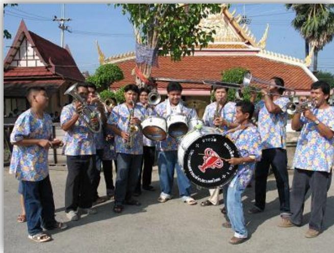
ภาพที่ 2.8 แตรวงในประเทศไทย