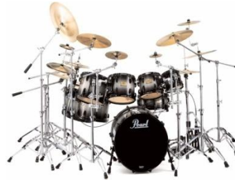
กลองชุด (Drum set)