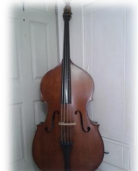
ดับเบิลเบส (Double Bass)