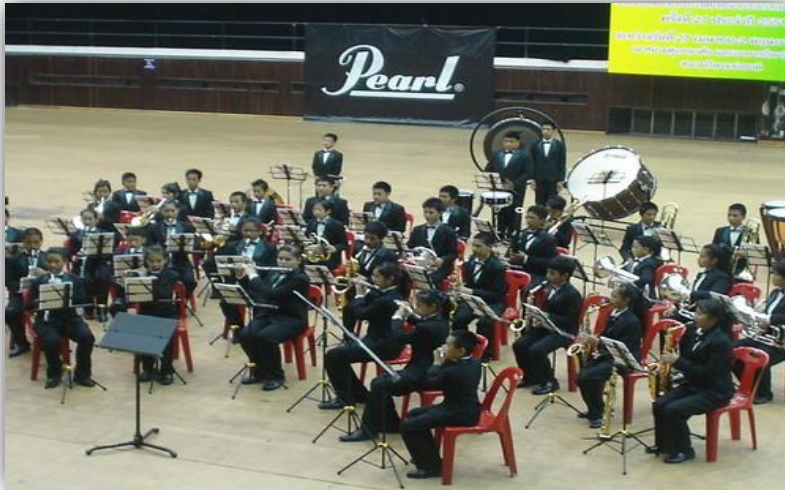
ภาพที่ 2.4 วงนั้บรเพลง

วงนั้บรเพลง (Concert band) หมายถึง การนำโยชวาทิตมานั้บรเพลงเป็นลักษณะของคอนเสิร์ต โดยนำบทเพลงที่เรียบเรียงเสียงประสานสำหรับโยชวาทิตมาบรเพลง ลักษณะคล้าย วงออร์เคสตรา หรืออาจนำเอาบทเพลงบรเพลงของวงออร์เคสตรามาเรียบเรียงเสียงประสานใหม่ เพื่อให้เหมาะสมกับโยชวาทิต จึงทำให้มีอีกชื่อเรียกว่า วงซิมโฟนิค แบนด์ (Symphonic Band) ดังภาพต่อไปนี้