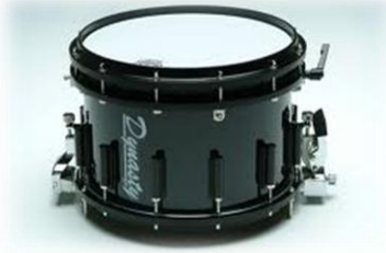
กลองเต็ก (Snare Drum)