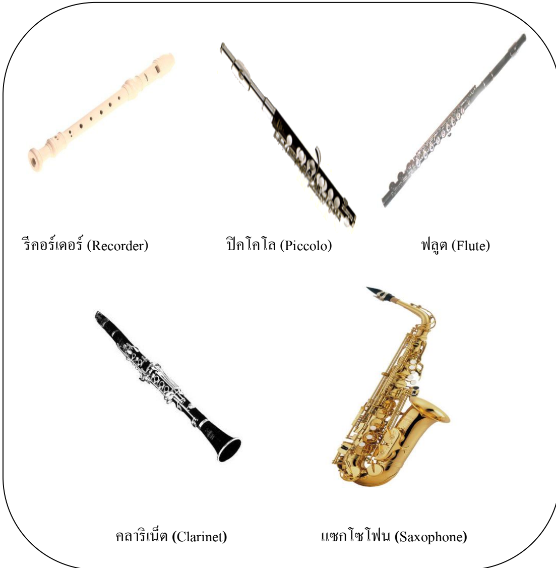
ภาพที่ 1.3 เครื่องลมไม้

2. เครื่องลมไม้ (Woodwind Instruments) เครื่องดนตรีประเภทนี้ เกิดเสียงโดยการเป่าลมเข้าไปในท่อให้ท่อสั่นสะเทือน คุณลักษณะของเสียงที่เกิดขึ้นจะแตกต่างกัน ตามขนาดของท่อ เครื่องดนตรีประเภทนี้มีหลายชนิดด้วยกัน ดังภาพต่อไปนี้