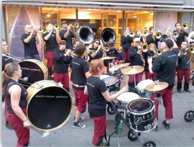
ภาพที่ 2.7 แตรวงมาตรฐาน

4. แตรวง (Brass Band) คือวงที่ประกอบด้วยเครื่องดนตรีประเภทเครื่องทองเหลืองและเครื่องกระทบไม่จำกัดจำนวน แตรวงเหมาะสำหรับใช้บรรเลงกลางแจ้ง แตรวงมาตรฐานของอังกฤษใช้เครื่องดนตรี 26 ชิ้น ในประเทศไทยใช้การแห่ต่าง ๆ เช่น บรรเลงแห่นาค แห่เทียนพรรษา ดังภาพต่อไปนี้