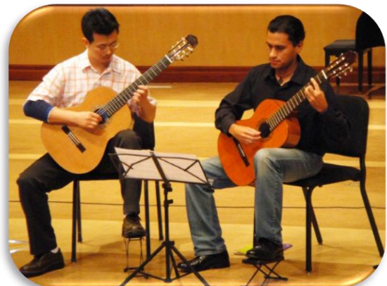
วงกีตาร์คูเอ็ต