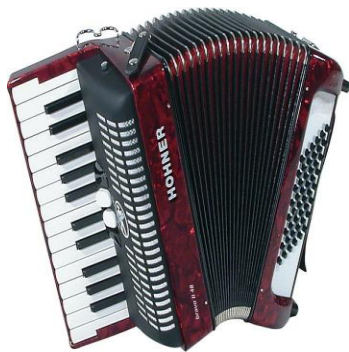
แอกคอร์ดียน (Accordion)