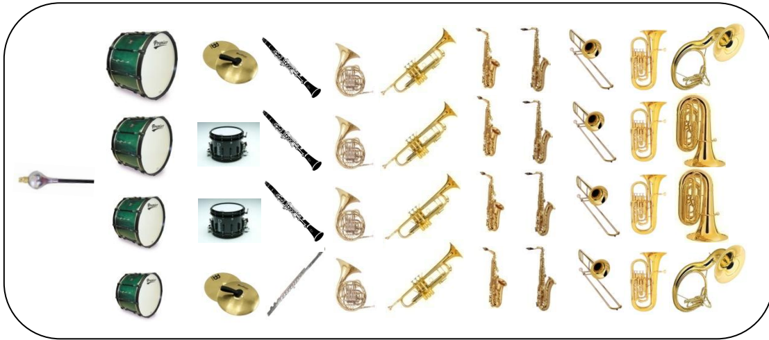
ภาพที่ 2.6 แผนผังการจัดตำแหน่งของเครื่องดนตรีของวงโยชวาทิต ขนาด 40 ชิ้น

การจัดวงโยชวาทิตขนาดเล็กจำนวน 40 ชิ้น ประกอบด้วย กลองใหญ่ 4 ใบ กลองเล็ก 2 ใบ ฉาบ 2 คู่ ฟลูต 1 คัน คลาริเน็ต 3 คัน ฮอร์น 4 คัน ทรัมเป็ต 4 คัน อัลโตแซ็คโซโฟน 4 คัน เทนเนอร์แซ็คโซโฟน 4 คัน ทรอมโบน 4 คัน ยูโฟเนียม 4 คัน ทูบา 2 คัน ซูซ่าโฟน 2 คัน ดังภาพต่อไปนี้