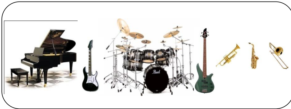
ภาพที่ 2.10 วงคอมโบ

6. วงคอมโบ (Combo band) หรือสตริงคอมโบ เป็นวงที่เอาเครื่องดนตรีบางส่วนมาจาก Popular Music อีกทั้งลักษณะของเพลงและสไตล์การเล่นก็เหมือนกัน จำนวนเครื่องดนตรีส่วนมากอยู่ระหว่างประมาณ 3 –10 ชิ้น เครื่องดนตรีจะมี พวกริทึม และ พวงเครื่องเป่าทั้งหมดไม้อะและเครื่องทองเหลือง เครื่องดนตรีที่ใช้เป็นหลักคือ กลองชุด เบส เปียโนหรือมีเครื่องเป่าผสมด้วยจะเป็นเครื่องลมไม้หรือทองเหลืองก็ได้ไม่จำกัดจำนวนแต่รวมแล้วต้องไม่เหมือนกับวงป๊อปปูล่ามิวสิก วงคอมโบก็เป็นสมอลล์ แบนด์ (Small Band) แบบหนึ่ง ดังนั้นวงนี้จึงเป็นวงที่มีขนาดไม่ใหญ่นักจึงเหมาะสำหรับเล่นตามงานรื่นเริงทั่ว ๆ ไป นอกจากนั้นยังเหมาะสำหรับเพลงประเภทไลต์มิวสิกอีกด้วยเพลงไทยสากลและเพลงสากลในปัจจุบันที่ใช้วงคอมโบเล่นตามห้องอาหารหรืองานสังสรรค์ต่าง ๆ ซึ่งมีการจัดวงดังภาพต่อไปนี้