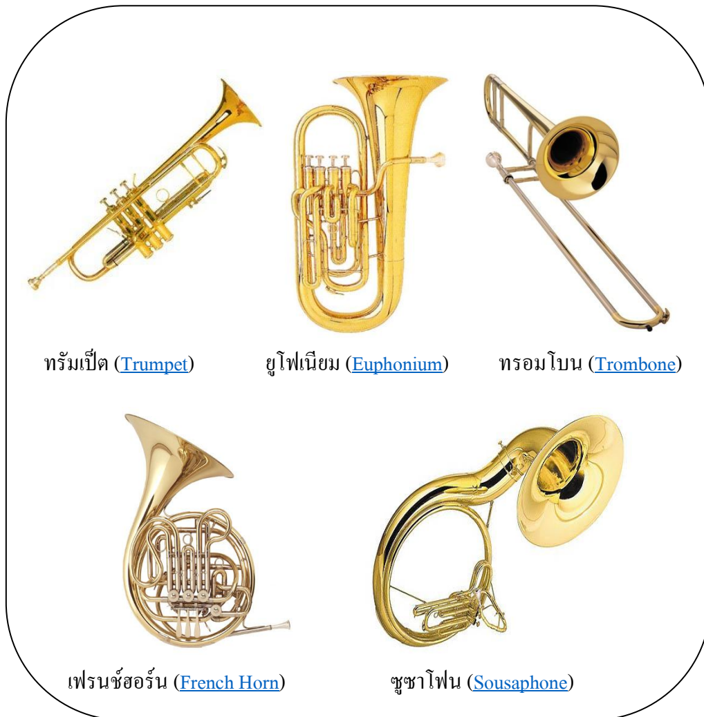
ภาพที่ 1.4 เครื่องลมทองเหลือง

3. เครื่องลมทองเหลือง (Brass Instruments) เครื่องดนตรีประเภทนี้มักทำด้วยโลหะผสมหรือโลหะทองเหลือง การเกิดเสียงโดยการเป่าลมเข้าไปในท่อให้ท่อสั่นสะเทือน การเปลี่ยนความสั้นยาวของท่อโลหะจะใช้ลูกสูบเป็นตัวบังคับ เพื่อเปลี่ยนระดับเสียง บางชนิดจะใช้การชักท่อลมเข้าออก เพื่อเปลี่ยนระดับเสียง ลักษณะเด่นของเครื่องดนตรีประเภทนี้ มีปากลำโพงสำหรับใช้ขยายเสียงให้มีความดังเจิดจ้า เรามักเรียกเครื่องดนตรีประเภทนี้รวม ๆ กันว่า “แตร” ขนาดของปากลำโพงขึ้นอยู่กับขนาดของเครื่องดนตรี ปากเป่าของเครื่องดนตรีประเภทนี้เรียกว่า “กำพวด” (Mouthpiece) เครื่องดนตรีประเภทนี้มีหลายชนิดด้วยกัน ดังภาพต่อไปนี้