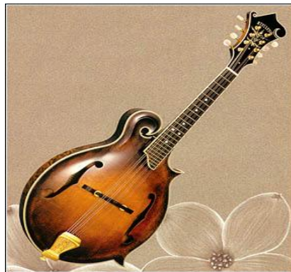
แมนโดลิน (Mandolin)