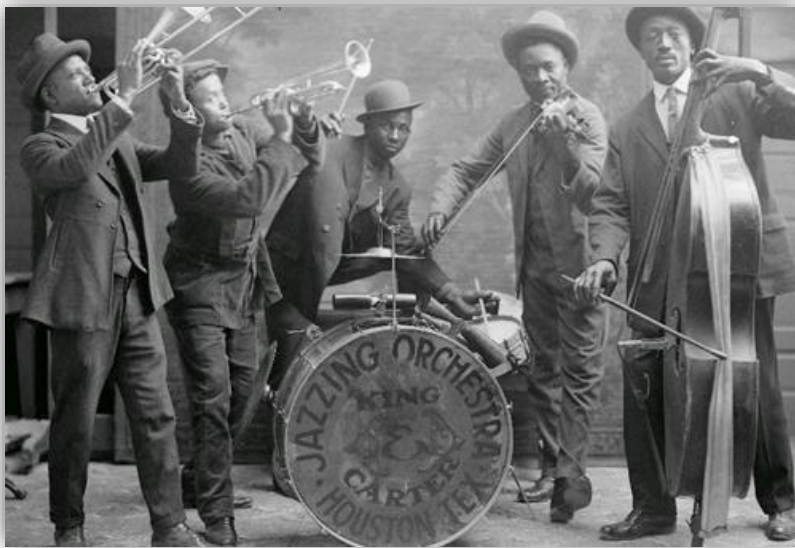
ภาพที่ 2.12 วงแจ๊ส

8. วงแจ๊ส (Jazz band) ดนตรีแจ๊สมีต้นกำเนิดราวทศวรรษ 1920 โดยวงดนตรีวงแรกที่น่าสำเนียงแจ๊สมาสู่ผู้ฟังหมู่ก็คือ ดิ ออริจินัล ดิกซีแลนด์ แจ๊ส แบนด์ (The Original Dixieland Jazz Band: ODJB) ด้วยจังหวะเดินรำที่แปลกใหม่ ทำให้โอดีเจบีเป็นที่กล่าวขวัญกันอย่างมาก พร้อมกับให้กำเนิดคำว่า "แจ๊ส" ตามชื่อวงดนตรี โอดีเจบีสามารถขายแผ่นได้ถึงล้านแผ่น รากลึกของแจ๊ส นั้นมีมาจากเพลงบลูส์ (Blues) คนผิวดำที่เล่นเพลงบลูส์เหล่านี้เรียนรู้ดนตรีจากการฟังเป็นพื้นฐาน จึงเล่นดนตรีแบบถูกบ้างผิดบ้าง เพราะจำมาไม่ครบถ้วน มีการขยายความด้วยความพึงพอใจของตัวเองเป็นหลัก ซึ่งกลายเป็นที่มาของ คีตปฏิภาณ (Improvisation) คือ การแต่งทำนองเพลงขึ้นมาใหม่ สด ๆ โดยไม่ได้เตรียมตัวมาล่วงหน้าหรือการโซโล่แบบด้นสด ในภายหลังดนตรี เร็กไทม์ ก็เชื่อว่ามีต้นกำเนิดคล้าย ๆ กันคือ เกิดจากดนตรียุโรปผสมกับจังหวะซัดของแอฟริกัน บลูส์และเร็กไทม์นี่เองที่เป็นรากของดนตรีแจ๊ส วงแจ๊สประกอบด้วยเครื่องดนตรีคล้ายคลึงกับวงคอมโบ แต่จะโดดเด่นในเรื่องของจังหวะและทำนอง ดังภาพต่อไปนี้