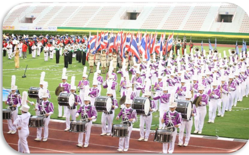
ภาพที่ 2.3 วงเดินแถว

วงเดินแถว (Marching band) เป็น โยธวาทิตที่มีลักษณะการเดินบรรเลง เป็นแถวตอนเล็ก อาจบรรเลงเฉพาะวงหรือนำหน้าขบวนต่างๆ ที่ต้องการรูปแบบที่เป็นระเบียบ เข้มแข็ง เร้าใจ ส่วนมากจะนิยมบรรเลงเพลงมาร์ช ดังภาพต่อไปนี้