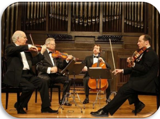
วงสตริงควอเต็ต