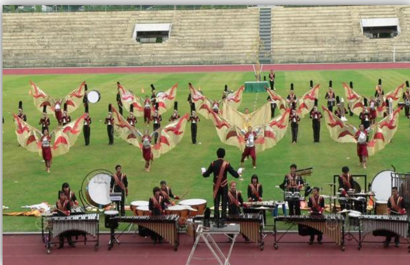
ภาพที่ 2.5 วงแปรชบวน

วงแปรชบวน (Display) หมายถึง การนำโยชวาทิตมาบรเพลงประกอบการแปรแถว โดย ผู้บรเพลงต้องเดินแปรรูปชบวนเป็นรูปต่างๆ ซึ่งเพลงที่ใช้บรเพลงต้องเหมาะสมกับรูปแบบที่แปรชบวนด้วย วงแบบนี้อาจมีชื่อเรียกอีกอย่างว่า โชว์แบนด์ (Show Band) ดังภาพต่อไปนี้