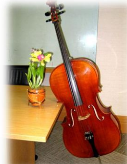
เซลโล่ (Violon Cello)