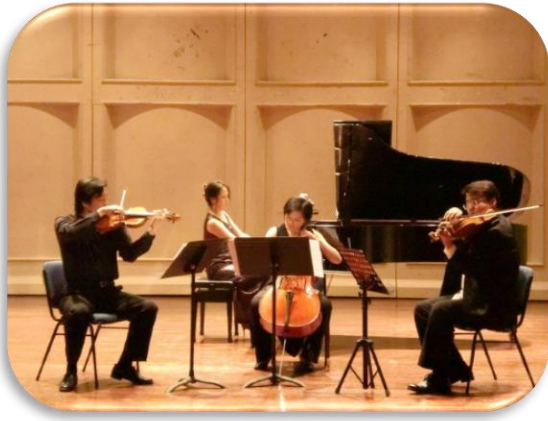
วงเปียโนควอเต็ต

การรวมวงแจ๊ซมีวอลีกที่มีจำนวนผู้บรรเลง 3 คน ซึ่งรวมวงโดยใช้เปียโน 1 หลัง ไวโอลิน 1 คัน และเชลโล่ 1 คัน เรียกว่าวงเปียโนทรีโอ ดังภาพต่อไปนี้