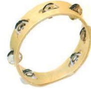
แทมบูรีน (Tambourine)