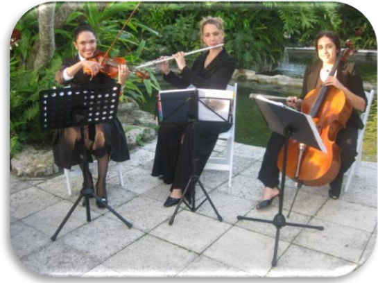
วงดนตรีทรีโอ