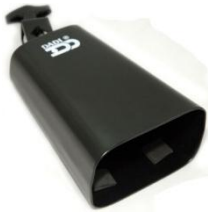
เคาเบลล์ (Cowbells)