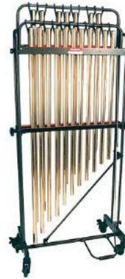
ระฆังราว (Tubular Bells)