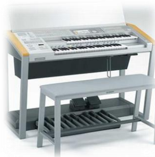
อิเล็กโทน (Electone)