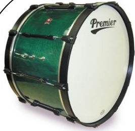
กลองใหญ่ (Bass Drum)